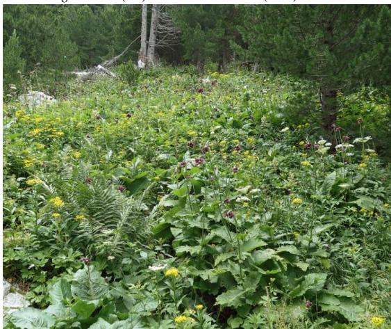
Cirsium x sudae ( C. carniolicum × C. greimleri )