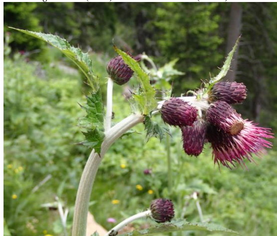
Cirsium greimleri : Koralpe