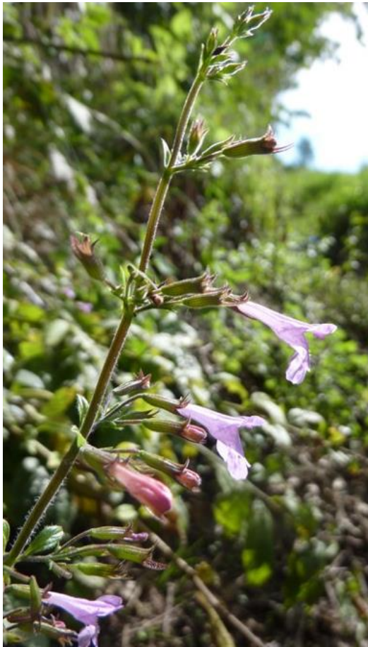
Wald-Bergminze / Clinopodium menthifolium