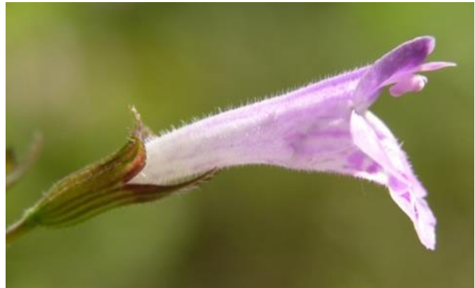
Blütendetailfoto von Clinopodium menthifolium