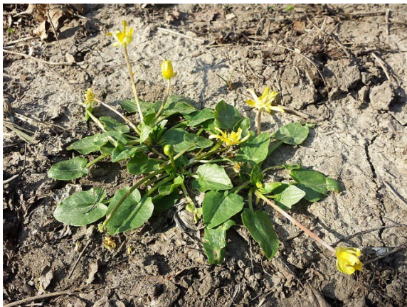
Ficaria calthifolia

Die Teilnahme ist für Vereinsmitglieder und StudentInnen frei. Gäste sind willkommen, wir bitten aber um eine Spende von 5 € für den Verein. Die Exkursion findet bei jedem Wetter statt!