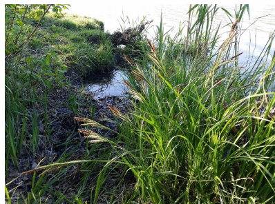
Carex buekii , neu für Wien